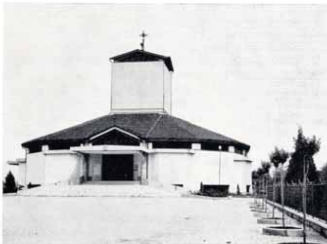
La nuova chiesa di Medonago